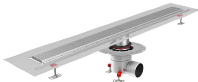
Showerdrain Public 110 Quadrato met horizontale uitloop