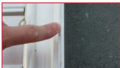
Afstandhouders tussen raam en deksel