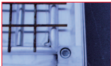
Corrosie op de wapening voor goede hechting

Kies dan voor de Alupura® tegeldekseels. Deze schachtafdekkingen, ook wel eens toezichtluiken genoemd, zijn vervaardigd uit een aluminiumlegering en voldoen aan de hoogste eisen voor wat materiaal, techniek en uitvoering betreft.