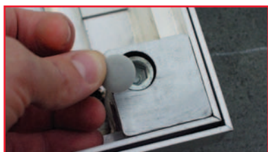
Hoekprofielen voor aansluiting met verharding, PVC-dopjes gaan vuilophoping tegen