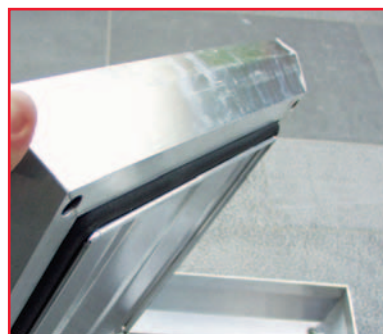
Water- en geurvaste dichtingsring