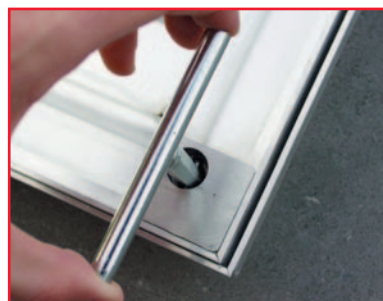
Vervolgens de sleutels gebruiken om het deksel met een kwartslag uit het raam te tillen