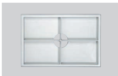
Cuvette de sol CleanBox Light en polypropylène.