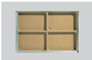
Cuvette de sol CleanBox en béton polyester.